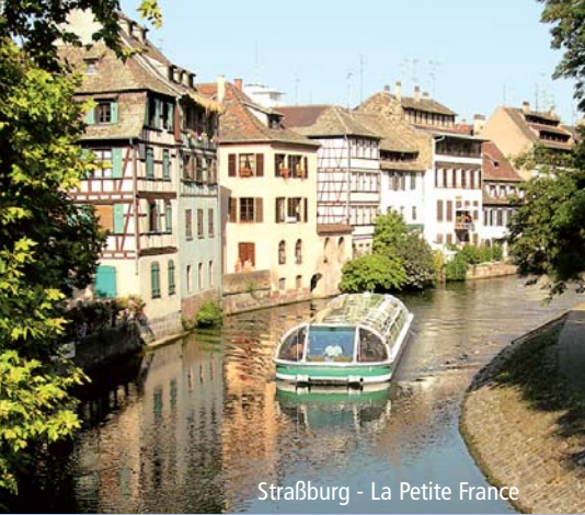
Straßburg - La Petite France