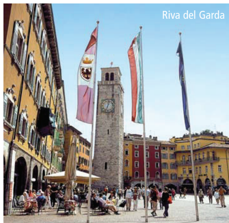
Riva del Garda

Rückreise auf der Autobahn über Bozen - Brenner - Innsbruck - Kufstein.